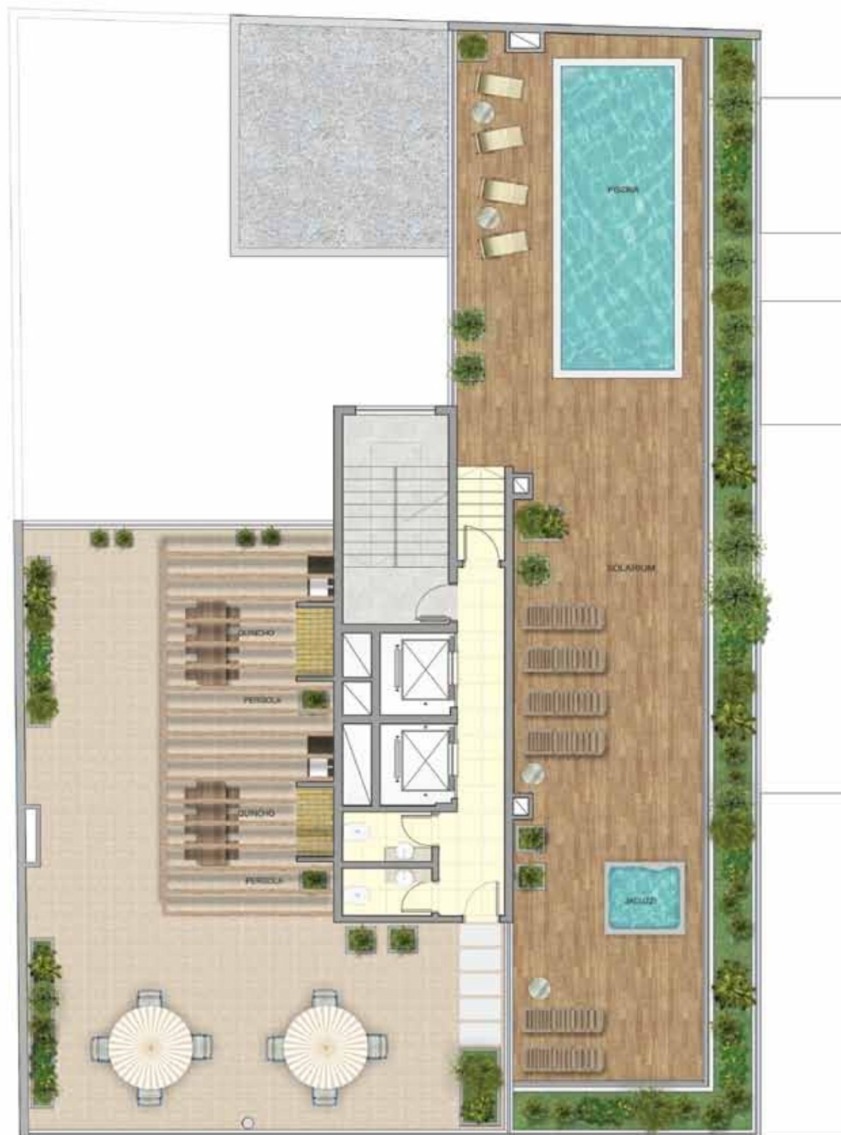
Planta del TopClub: Piscina, Parrilleros, Solarium y Jacuzzi.

Un edificio de categoría superior en esquina con un amplio mix de departamentos desde 33 a 192 m 2 con piscina, solarium y parrilleros en el último piso.