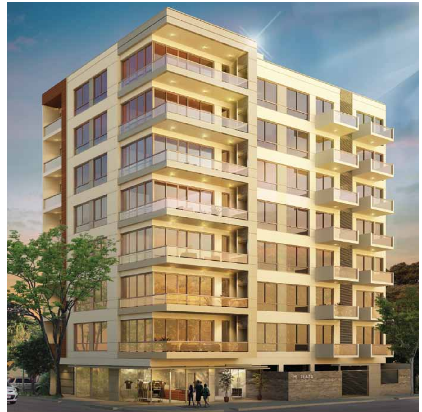
Fachada del edificio