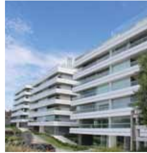
INDIGO PUNTA DEL ESTE