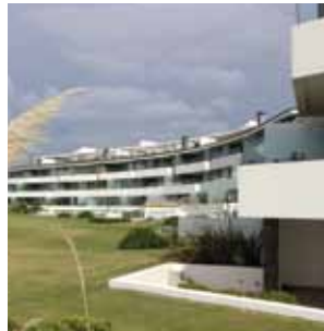
ESTURION PUNTA DEL ESTE