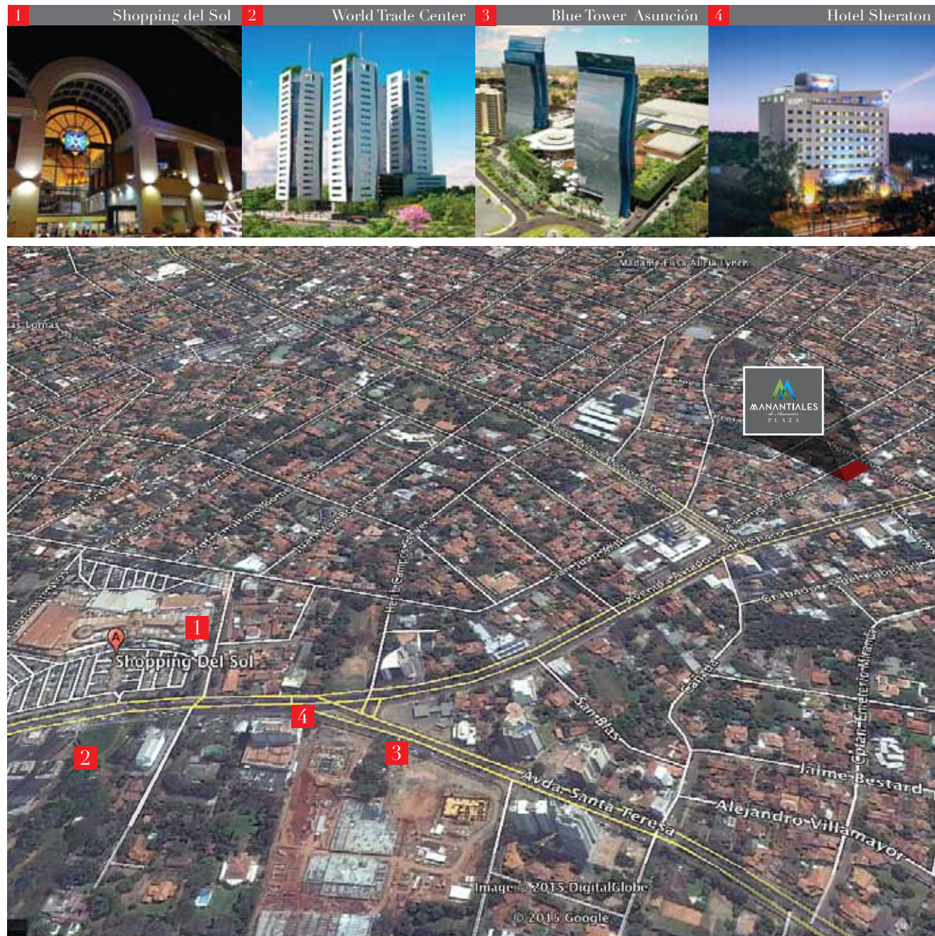
Plano de ubicación

En una de las mejores y más tranquilas zonas residenciales de la ciudad, frente a una plaza y a sólo 5 cuadras del nuevo centro de negocios de Asunción.