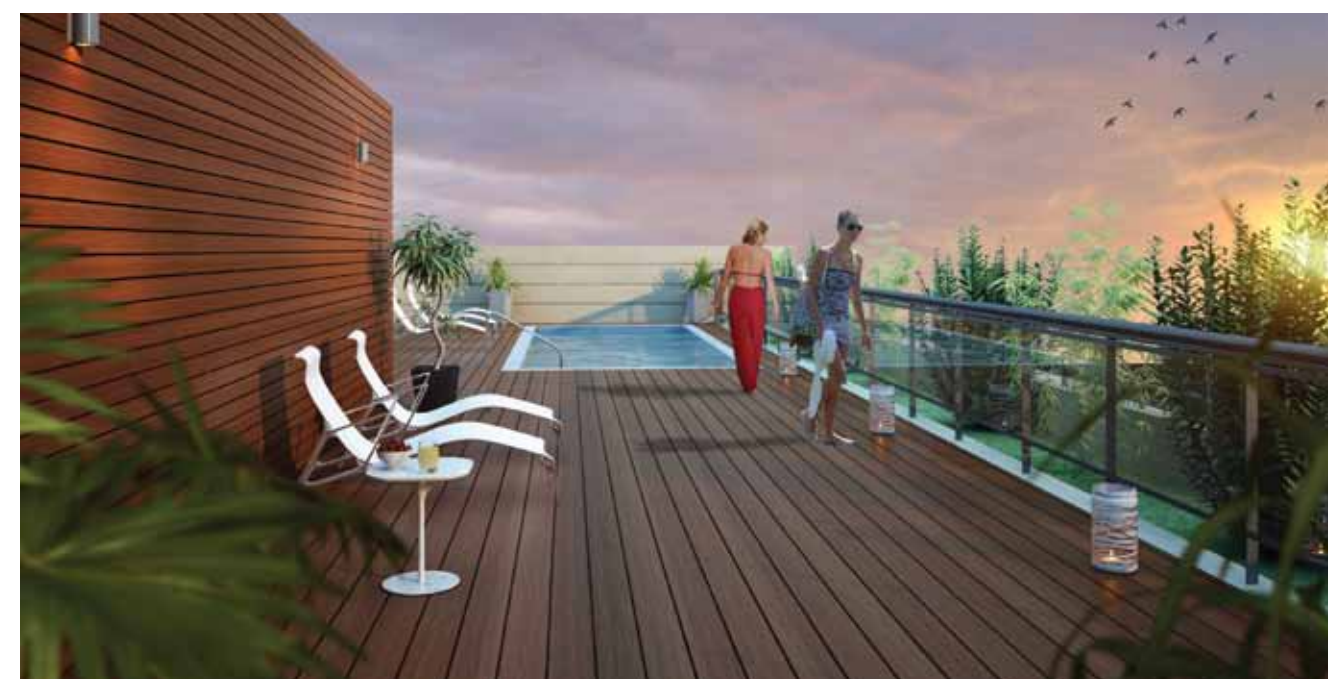
Vista de la terraza y piscina