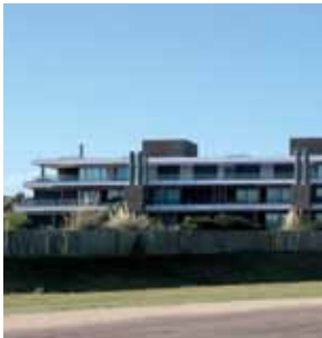
SELENZA PUNTA DEL ESTE