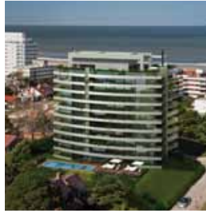
ESMERALDA PUNTA DEL ESTE