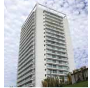
YOO PUNTA DEL ESTE