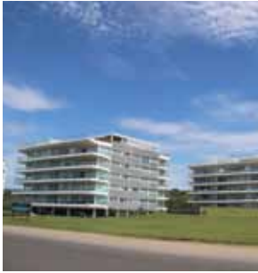
SILENTE PUNTA DEL ESTE

Alvarez y asociados es una empresa desarrolladora y de gestión de obra con 30 años de trayectoria y más de 300.000 m2 construidos entre Punta del Este y Montevideo. En estos últimos años se ha convertido en una de las principales empresas del sector y protagonista del importante desarrollo inmobiliario local. La empresa posee certificación ISO 9001 desde el año 2011 gracias a los altos estándares de calidad con los que trabajan en cada etapa del proceso constructivo.