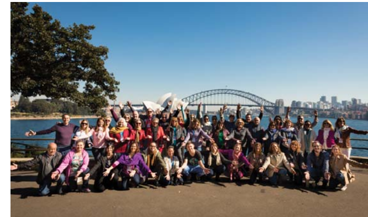
Viaje del Presidente 2017 · Sydney, Australia.