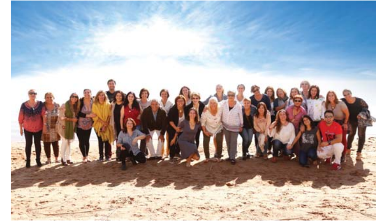
Festejo Nacional 2017 "Juntos más Felices".

Encuentra una oportunidad de ingresos que te haga sentir bien y hazte Consultora SwissJust.